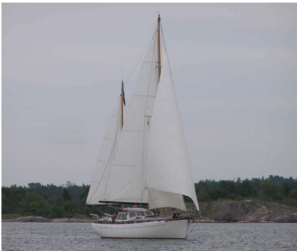
Akaia med fyllda segel. Besättning Evalotte och Jan-Åke