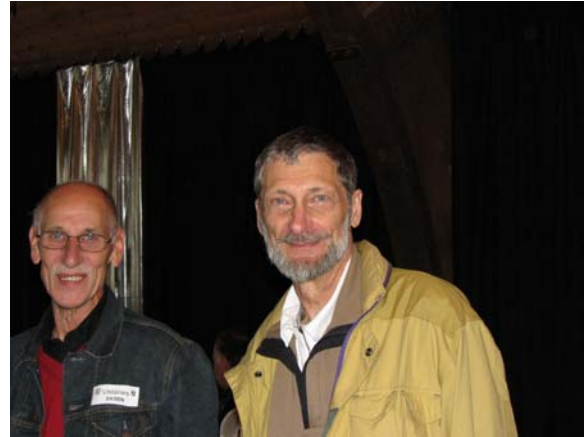
SM5SZG och SM5DUB pratar radio- minnen