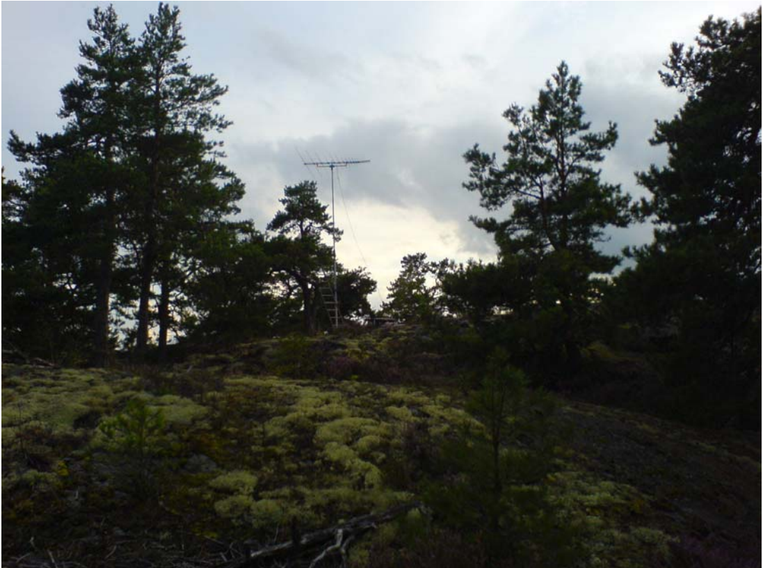
Antennplacering med fri sikt. Använder en portabelmast som i det här fallet lyfte upp logperiodaren 6 – 7 meter.