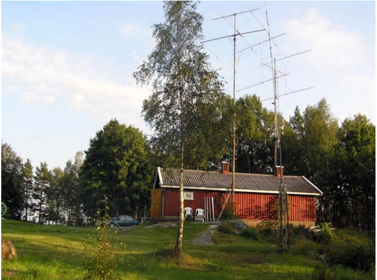
Haldens Radioklubb har QTH i ett ombyggt garage

Med min magnetfotsantenn når jag ganska många repeatrar upp mot Oslo, Sandefjord, Skien och Moss m. fl.