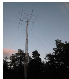
En bra antenn