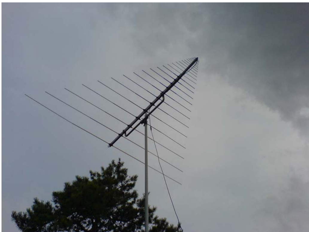
En 22 elements logperiodare för 50 – 1300 MHz. . Men vart är den riktad??