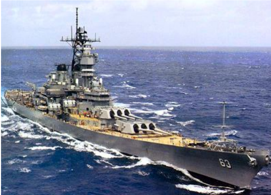
Slagskeppet Missouri i öppen sjö