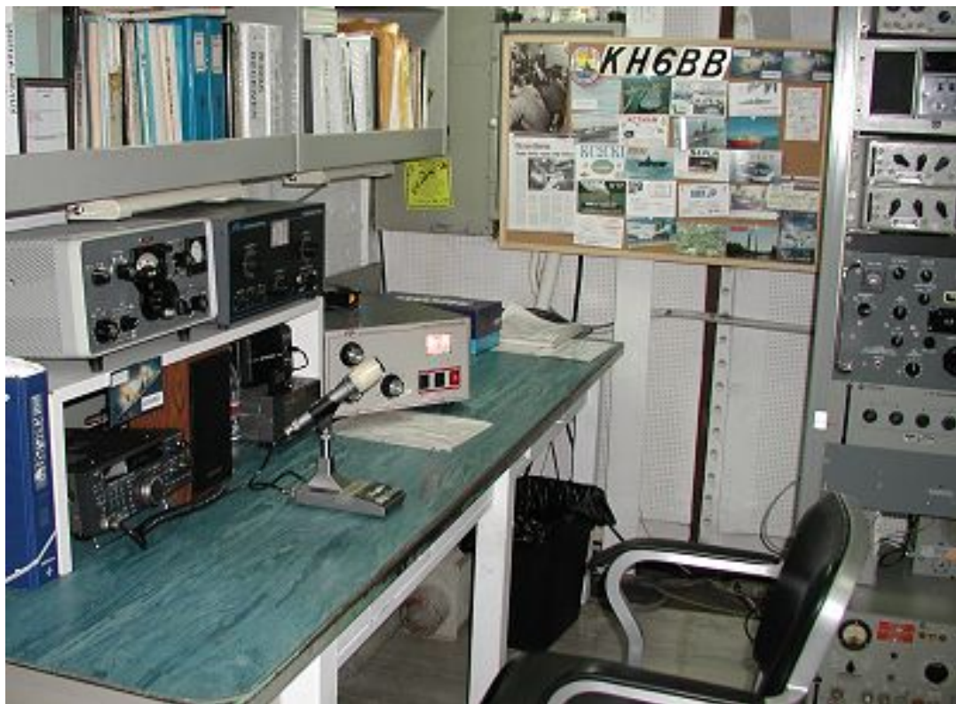
Ett av fartygets radiorum är numera omgjort för amatörradio med signalen KH6BB